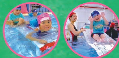
台の上をワニの真似をして楽しく歩きます。

※級認定は行いません。※1コースはアイランドのご利用が初めてのお子様を対象です。級をお持ちのお子様は通常短期コースへお申し込みください。